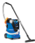
AERO 26 L