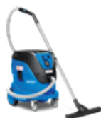
ATTIX 44 L