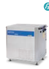
SH SOLAR E