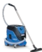
ATTIX 33 L