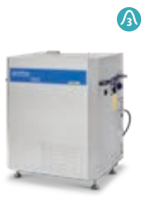
SH SOLAR G