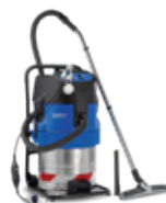
ATTIX 7 SPECIAL PURPOSE