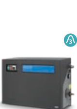
SC UNO 6P