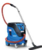
ATTIX 44 M