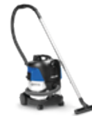
AERO 21 INOX