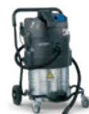
ATTIX 791-2M B1