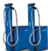
SB STATION TANDEM