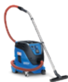
ATTIX 33 M