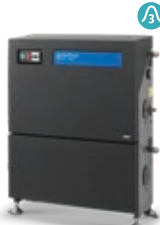
SC DUO 7P