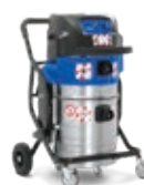
ATTIX 995-0H/M TYPE 22