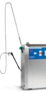
SH AUTO 5M