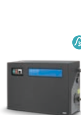
SC UNO 5M