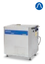
SH SOLAR D