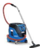
ATTIX 33 H